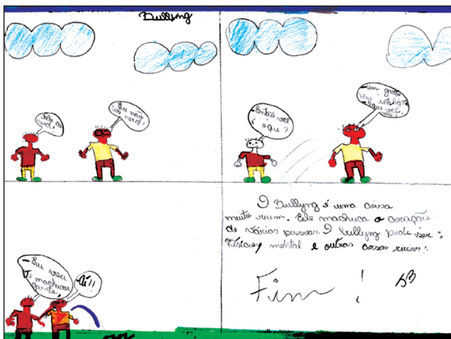
Figura 3 – Trecho de história em quadrinhos feita pelos próprios alunos sobre bullying.

violência, à dor, aos sofrimentos, aos valores éticos de conduta, de conviver e, em muitos casos, insensíveis até mesmo às orientações educativas. As instituições escolares permanecem com o desafio de colaborar na construção e no desenvolvimento de políticas de prevenção ao bullying e de disseminação de uma cultura de paz e de tolerância mediada pela prática do diálogo.