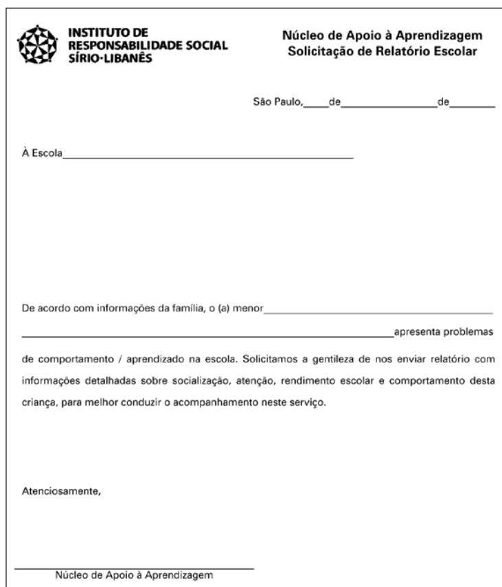
Figura 1 – Primeiro modelo de encaminhamento para o Programa Dificuldade de Aprendizagem do APE-HSL.

A partir das discussões realizadas nos encontros bimestrais entre nosso serviço com os