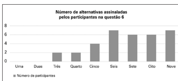
Figura 2 - Número de alternativas assinaladas por participante na questão 6, relativa aos aspectos que podem ser trabalhados pelo profissional.

Os resultados obtidos nessa questão poderiam ser explicados pelo próprio perfil dos participantes deste estudo que, em seu cotidiano, têm maior contato com alunos ditos "de inclusão" ou, ainda, a própria seleção feita pelo sistema educacional que elege quais alunos têm direito ao atendimento educacional especializado poderia estar reforçando a ideia de que os demais não necessitam de um olhar diferenciado.